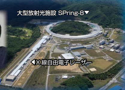
◀X線自由電子レーザー